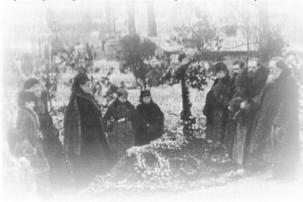
РОДНЫЕ И ДРУЗЬЯ

писателей-философов, затрагивавших наиболее острые жизненные вопросы.