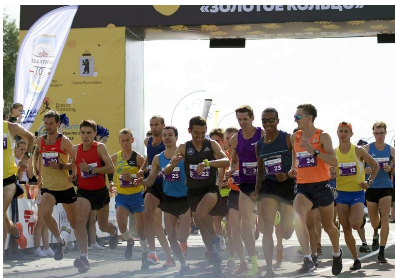
Старт чемпионата России по полумарафону

Элитные марафонцы, к примеру, за год пробегают не более 1-2 целевых марафонов. Конечно, все системы организма восстанавливаются за 2-3 недели, но тренеры рекомендуют делать перерыв между целевыми марафонами на 5-6 месяцев. За этот срок атлет успевает восстановиться психологически и качественно подготовиться к следующей гонке.