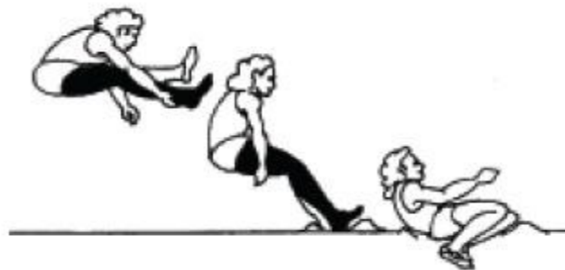
Рис. 20. Фаза приземления в прыжке в длину

тазобедренных и коленных суставах с одновременным энергичным выведением рук вперед и наклоном плеч вперед-вниз или в стороны-вперед (рис. 20).