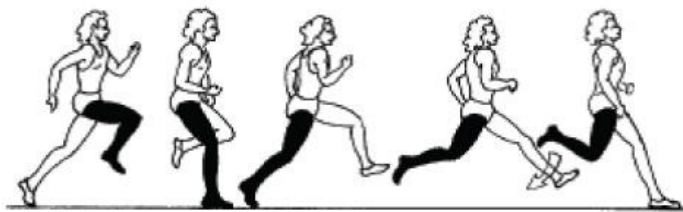
Рис. 16. Постановка толчковой ноги в прыжке в длину

Подготовка к отталкиванию , выражается в небольшом подседании на предпоследнем шаге. Последний шаг выполняется быстрее и несколько короче, чем предыдущий. Толчковая нога вместе с тазом обгоняя туловище, ставится на место отталкивания почти выпрямленной, всей стопой (рис. 16). После завершения амортизационной фазы начинается разгибание толчковой ноги с одновременным махом свободной ногой и руками. Мах выполняется активным движением вперед-вверх согнутой в колене ногой. Одноименная маховой ноге рука отводится в сторону-назад, другая делает энергичный взмах вперед-вверх и несколько внутрь (рис. 17).