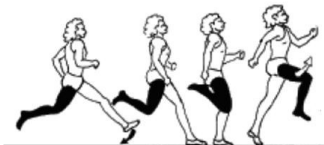
Рис. 17. Фаза отталкивания в прыжке в длину

Подготовка к отталкиванию , выражается в небольшом подседании на предпоследнем шаге. Последний шаг выполняется быстрее и несколько короче, чем предыдущий. Толчковая нога вместе с тазом обгоняя туловище, ставится на место отталкивания почти выпрямленной, всей стопой (рис. 16). После завершения амортизационной фазы начинается разгибание толчковой ноги с одновременным махом свободной ногой и руками. Мах выполняется активным движением вперед-вверх согнутой в колене ногой. Одноименная маховой ноге рука отводится в сторону-назад, другая делает энергичный взмах вперед-вверх и несколько внутрь (рис. 17).