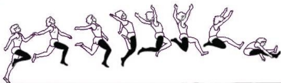
Рис. 19. Фаза полета в прыжке в длину способом «прогнувшись»

В способе «прогнувшись» после взлета маховая нога, разгибаясь в колене, опускается вниз и движется назад по широкой дуге, приближаясь к находящейся сзади толчковой ноге. В момент, когда маховая нога находится в крайнем нижнем положении, прыгун начинает дугообразное отведение рук в сторону-назад или назад-вверх в стороны. Одновременно таз выводится вперед и прыгун прогибается в поясничной и грудной области (рис. 19).