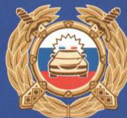
Госавтоинспекция МВД России